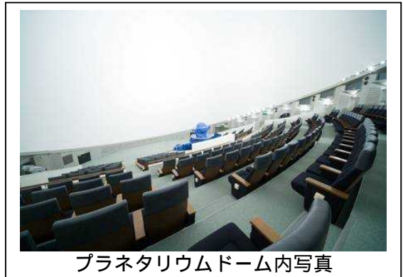
プラネタリウムドーム内写真