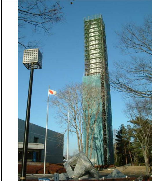
足場とシート養生の様子