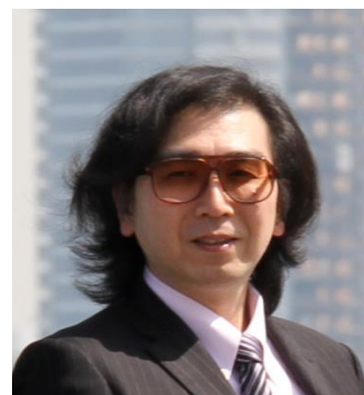
講師 山海 嘉之 氏

今回の講演会では、G7で科学技術大臣にも紹介された最先端の「革新的サイバニクスシステム」と私たちの未来について、最前線の情報を踏まえて山海先生にお話をさせていただきます。皆さんにも、その未来が見えてくるでしょうか。楽しみデスね！